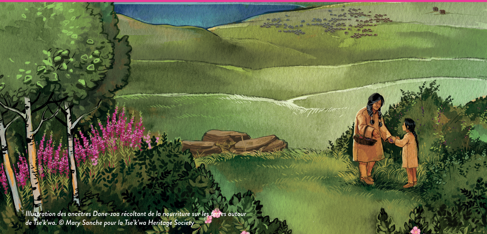
Illustration des ancêtres Dane-zaa récoltant de la nourriture sur les terres autour de Tse'k'wa. © Mary Sanche pour la Tse'k'wa Heritage Society