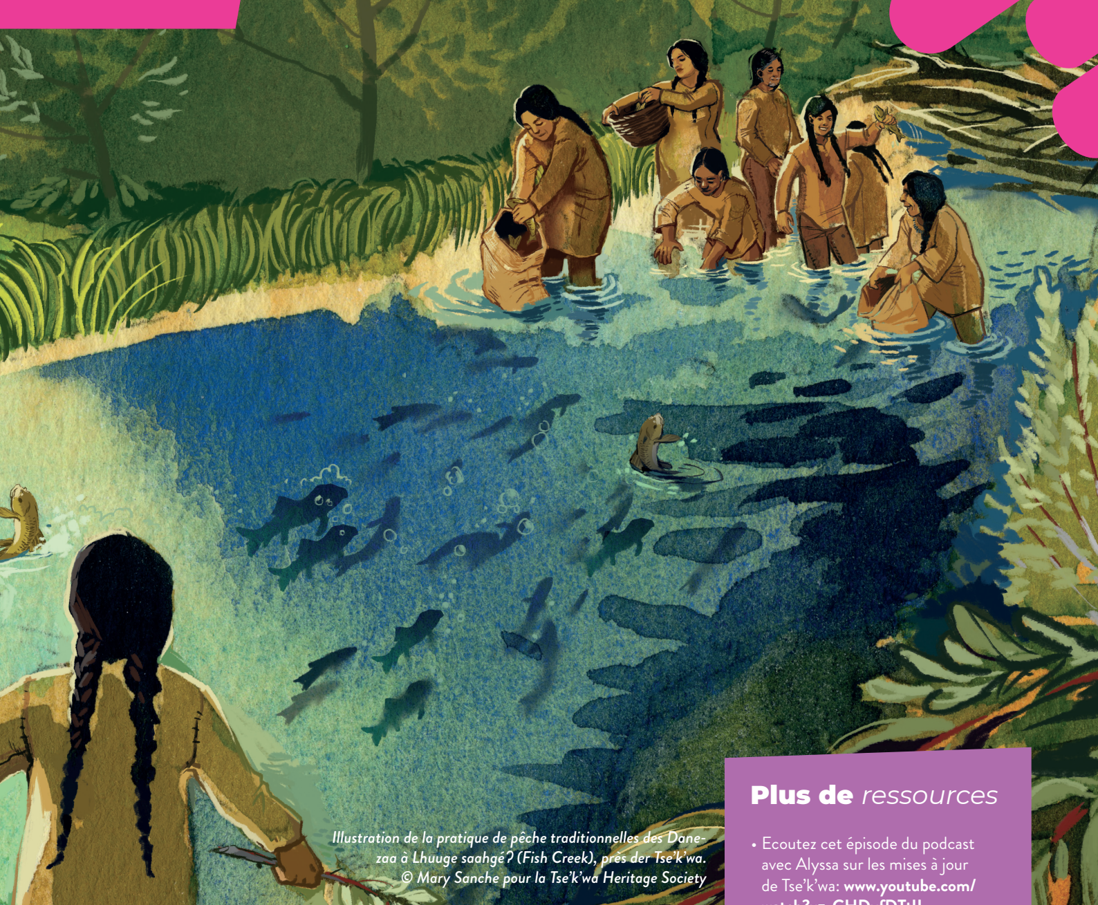
Illustration de la pratique de pêche traditionnelles des Dane-zaa à Lhuuge saahgé? (Fish Creek), près de Tse'k'wa. © Mary Sanche pour la Tse'k'wa Heritage Society

en personnes peut être un excellent moyen d'obtenir des informations ou d'être mis en contact avec quelqu'un qui pourrait en savoir plus sur la région.